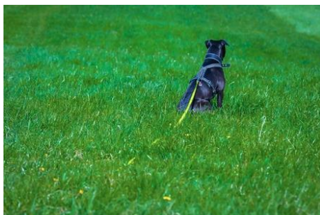
Chien attaché à une longe.

A moins que vous ne sortiez votre chien que sur la plage ou en rase campagne, la longe est rarement adaptée aux sorties quotidiennes. C'est trop long de la manipuler.