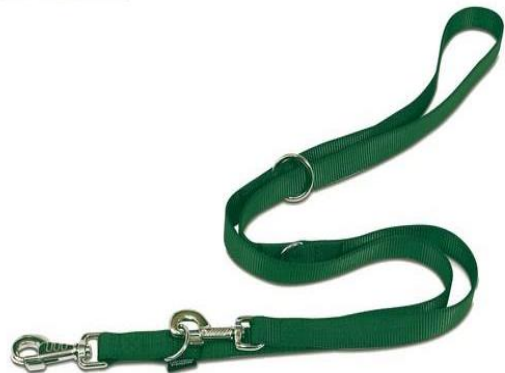
Laisse nylon multipositions pour chiens. Longueur : de 1 à 2 m