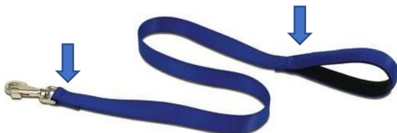
Laisse en nylon classique, poignée cousue double rembourrée mousse. Longueur : de 1 m

Avec les modèles réglables, vous pouvez modifier la longueur d'une laisse en nylon, généralement il y a 3 réglages jusqu'à 2 m, grâce à des anneaux. Vous avez une laisse plus polyvalente, pratique pour alterner entre les endroits bondés et les endroits tranquilles.