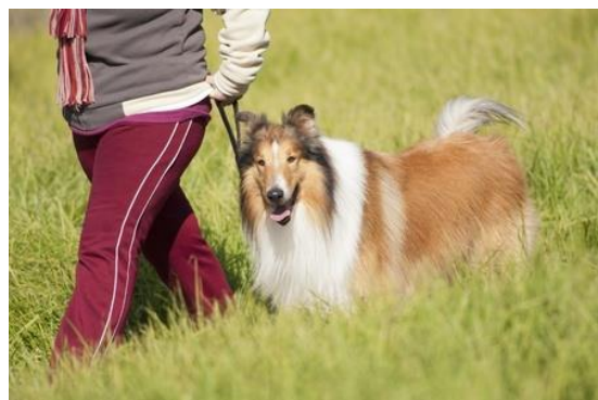
Laisse pour chien, cousue en cuir double. Longueur 0.5 m

Une laisse très courte est parfois bien pratique mais ne devrait pas être la solution quotidienne et permanente à vos problèmes de marche en laisse.